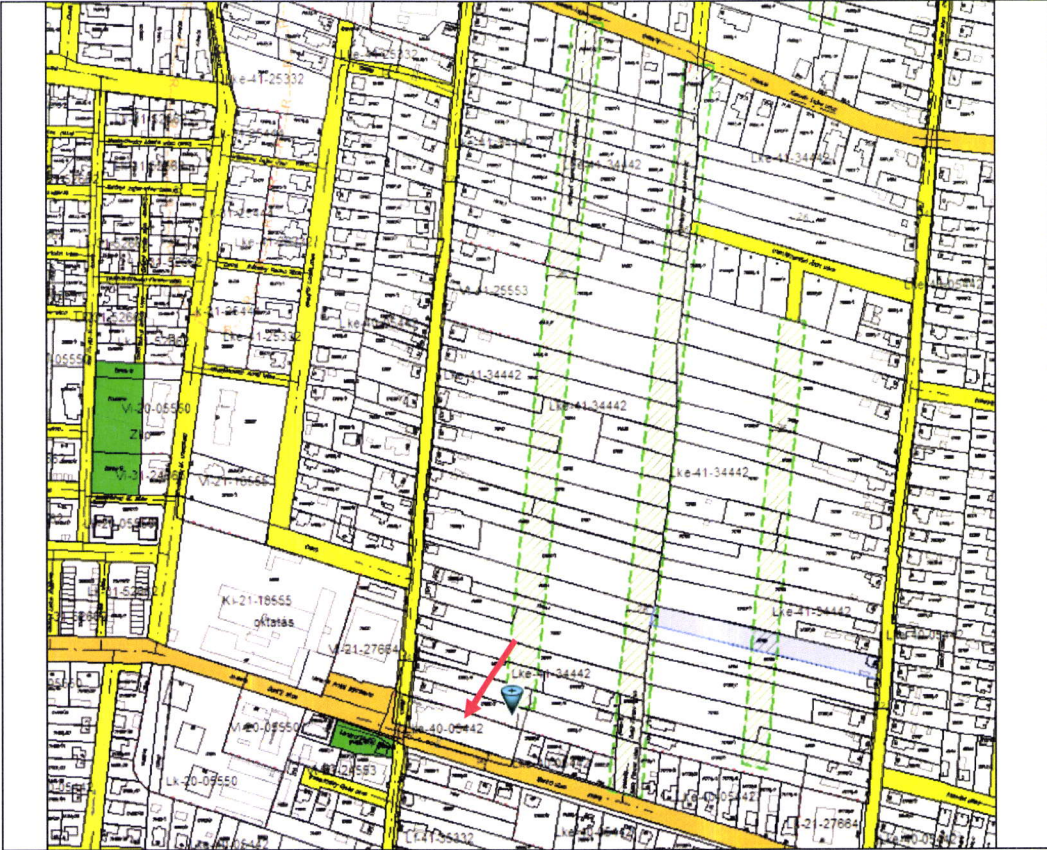
Szabályozási Tervlap részlete a kiemelt fejlesztési területté nyilvánítandó területegységre