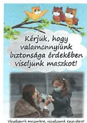
12. kép: Átalakult városmarketing feladatok a városi kommunikációban