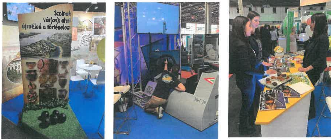
2. kép: Szolnok város standja a 43. Utazás Kiállításon

A színes, változatos programok mellett, a szolnoki szakemberek a lehető legszélesebb skálán nyújtottak tájékoztatást a 2020. évi rendezvényekről, eseményekről, fesztiválokról, a szabadidő aktív eltöltésének lehetőségeiről, turisztikai attrakciókról az érdeklődők számára.