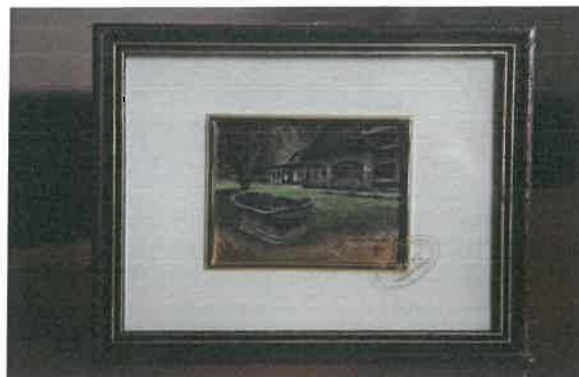
5. kép: Vásznon- és aranyozott képek

A promóciós termékek köre a vírushelyzetnek köszönhetően bővült, de ugyanakkor át is alakult. Megjelentek az egyedi szájmaszkok, hiszen viselésük hatékony az influenzával, vírusokkal, baktériumokkal szemben, mindemellett a népszerűsítés igen hatékony eszközeivé is váltak az elmúlt időszakban. Mindezen okok miatt a várost promotáló, egyedi, több méretben elérhető, 130 db kék-sárga színű-, illetve elegánsabb megjelenést kölcsönző, 120 db állítható méretű fekete maszk elkészítése történt meg.