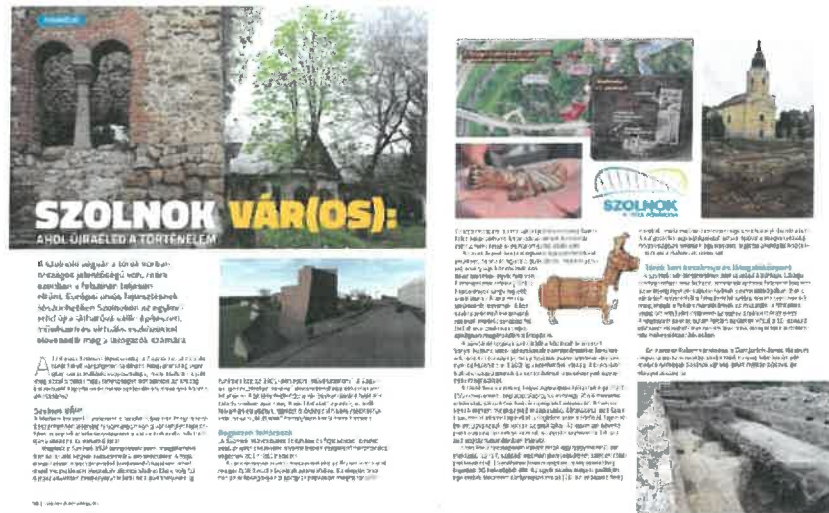
1. kép: Ízelítő a 2020. évi újságmegjelenéseinkből