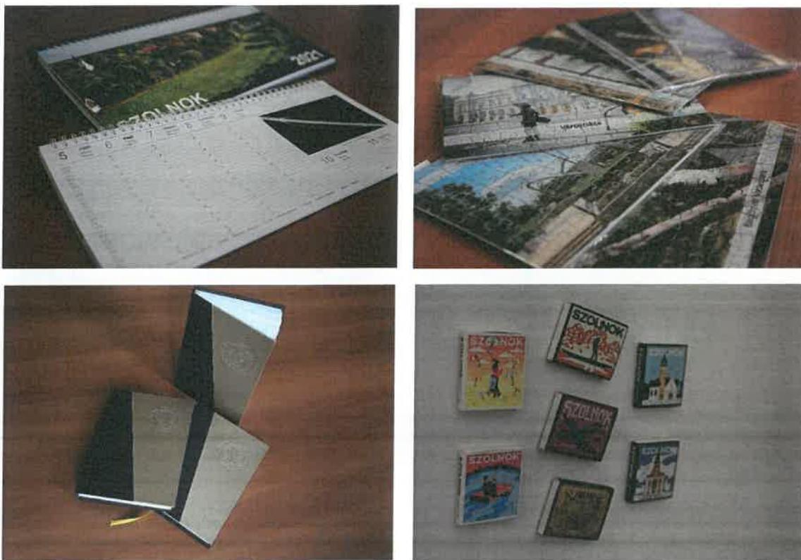
4. kép: Promóciós ajándékaink egy része

A költségtakarékosság, a hatékonyság elvét szem előtt tartva, 50 db egyedi asztali naptár, 50 db hűtőmágnegyufa, 80 db vakdombornyomott jegyzetömb, valamint 300 db, szolnoki nevezetességeket ábrázoló puzzle beszerzése történt meg.