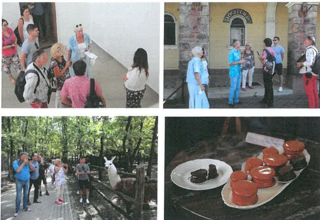
10. kép: Study tour