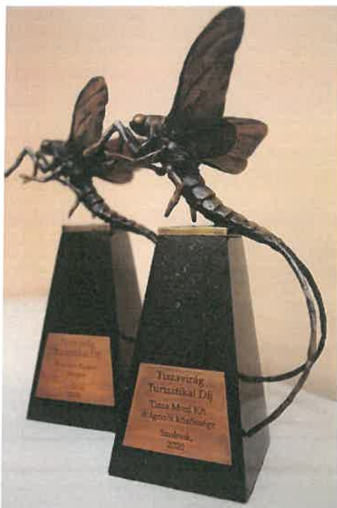
9. kép: Tiszavirág Turisztikai Díj 2020