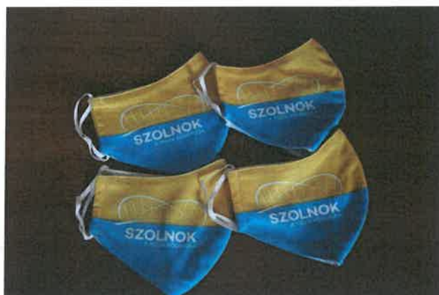
6. kép: Szájmaszkok, mint a promóció új eszközei