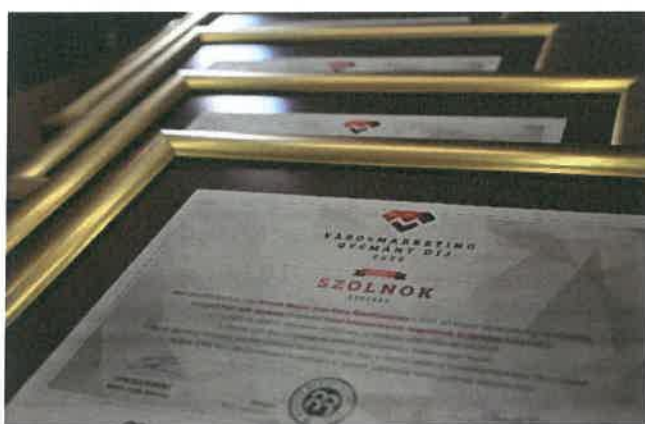
7. kép: Magyar Városmarketing Díj 2020

A gyémánt ranglistán szereplő 63 település közül Szolnok jelenleg az előkelő 7. helyen szerepel, maga mögé utasítva olyan városokat, mint például Szeged, Nyíregyháza, Pécs, Kecskemét, Székesfehérvár, Hévíz vagy akár Sopron.