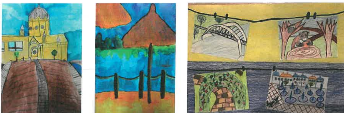
11. kép: Ízelítő az „Üdvözet Szolnokról” rajzpályázat díjazottjainak munkáiból

A pályázati kategóriánkénti 1-3. helyezett rajzok készítői ajándécsomagban részesültek, a legkreatívabb alkotások pedig képeslap formájában is megjelenhettek.