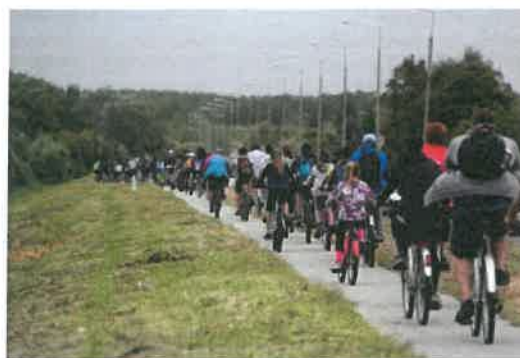
8. kép: Haladó Kerékpárosbarát díjak