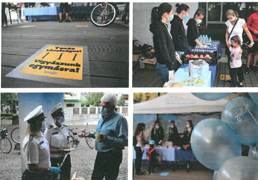
3. kép: A 2020. évi Bringás reggeli rendezvény

A Szolnoki Rendőrkapitányság is csatlakozott rendezvényünkhöz, melynek keretében kiegészítő szolgáltatásként „BikeSafe” kerékpár-regisztrációt biztosítottak az érdeklődők számára.