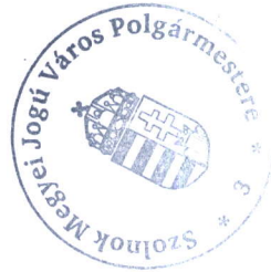
Szalay Ferenc polgármester