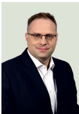
Györfi Mihály polgármester